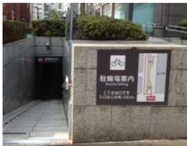
本庁舎地下駐車場内の誘導案内板（写真左）、本庁舎駐輪場出口の案内板（写真右）