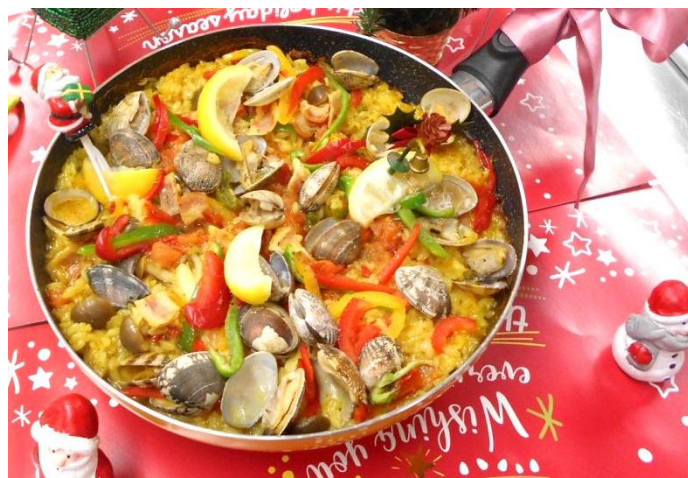
エコレシピコンクール最優秀作品 「華やかエコなパエリア」