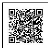
スマートフォン用

トップページ⇒イベントカレンダー⇒3月17日⇒環境にやさしいお料理教室 もしくは、下のQRコードからもホームページにアクセスできます。