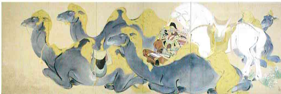
【上 top】 川端龍子《源義経(ジンギスカン)》1938年 Ryushi Kawabata Minamoto Yoshitsune (Genghis Khan), 1938