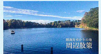
勝海舟ゆかりの地 周辺散策

ベンチや水飲み場もありますので、ゆっくりお過ごしください。 ※開門時間は記念館 に準じます。