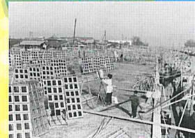
大森の河岸の海苔干場 昭和38年1月撮影

写真展 「東京オリンピックに沸いた あの頃の手延」 7月20日(火)～11月14日(日)