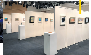
チャリティーオークション