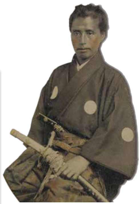
勝海舟建言書草稿