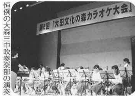
恒例の大森三中吹奏楽部の演奏