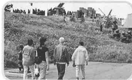
美ヶ原高原美術館