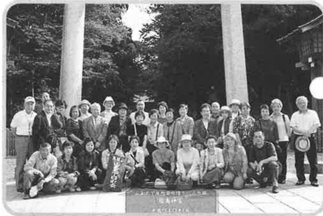
鹿島神宮 大鳥居の前