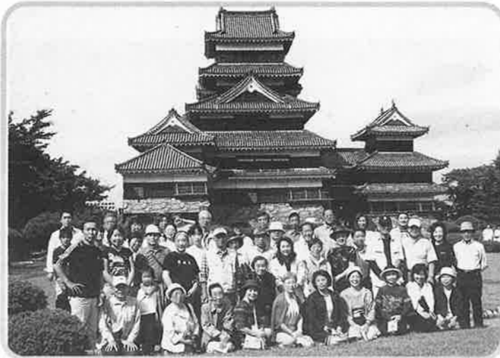
松本城をバックに