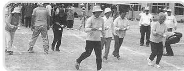
全員参加のスプーンレース