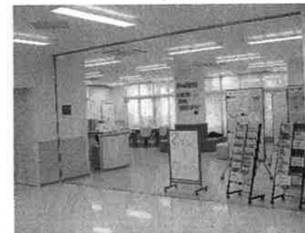
子育て応援コーナー(1階)

区内で3つ目の大田区子ども家庭支援センター(愛称キッズな)が、平成20年2月1日に大森地区に開設されました。「キッズな」は、子育て世代に親しんでもらえるように、子ども(キッズ)と絆の“な”を合わせたもので、愛称としてつけられました。大田区子ども家庭支援センターが、家庭や地域との絆になり、心の架け橋となるようにとの思いも込められているのです。キッズな大森を「知らなかった」また、「そこは保育所なの」という声に答えて、あらためてご紹介いたしましょう。0~3歳児の子育て奮闘中の保護者とお子さんが交流し、情報交換をしたり、悩みを打ち明け合ったり、もちろん、専門家による相談も予約制で受けられます。やさしいパステルカラーの空間で、心身を解き放してみませんか。散歩や買物の途中にちょっと立ち寄ってみてはいかがでしょうか。*利用方法は、別表の通りです。