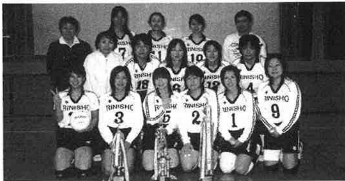
戦い終わって「はい!チーズ」