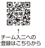
↑ チーム入二への登録はこちらから