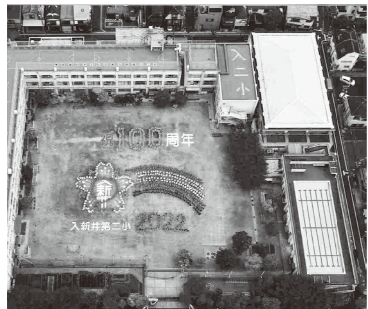
▲開校100周年を記念した航空写真

昨年、開校100周年を迎えた入新井第二小学校の全面改築に向けて、この春から仮設校舎の建設準備が進められています。令和11年度(予定)まで続くこの工事に、地域の方々はどんな思いを抱くでしょうか。大正11(1922)年に開校した当時の木造校舎から、幾度かの改築を経て来た校舎を懐かしく思われる卒業生たちも多くいらっしゃることでしょう。新たな100年に向かって建設される入二小の新校舎を子どもたちと共に楽しみにしつつ、校舎のみならず変貌してゆく学び舎を応援したいと思います。