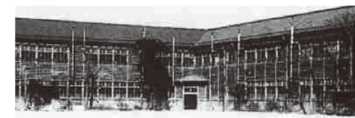
▲昭和17年の校舎全景