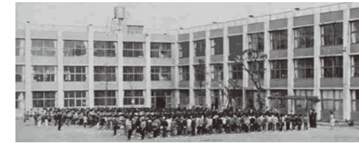
▲昭和38年の校舎全景