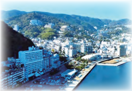
熱海後楽園ホテルからの景色

四年ぶりのバス旅。余裕をもって楽しみたいと計画しました。車窓からは天晴雪化粧の富士山が見えます。最高な気分熱海へ。昼食前に、熱海郷の地主の神と言われる来宮神社にお参り。大楠の生命力にあやかり寿命を数年延ばした会員さんもいた様です。