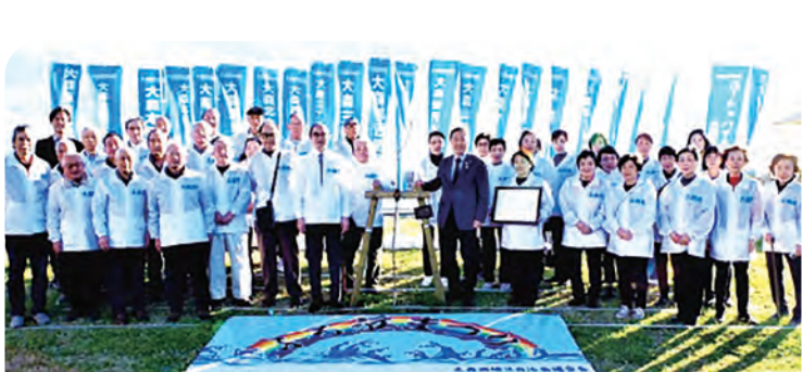
次回のふる浜まつりは令和6年10月13日(日)です