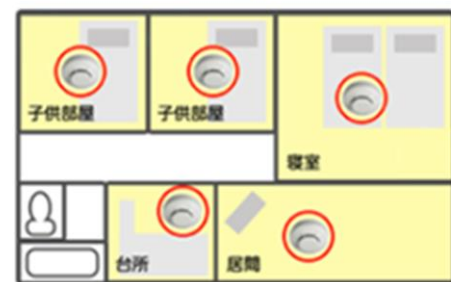
■ マンションやアパートの場合

※メゾネットタイプの場合は、階段にも設置が必要です。 ※建物の共用部分である階段、廊下、エレベーターホール等には、設置の必要はありません。