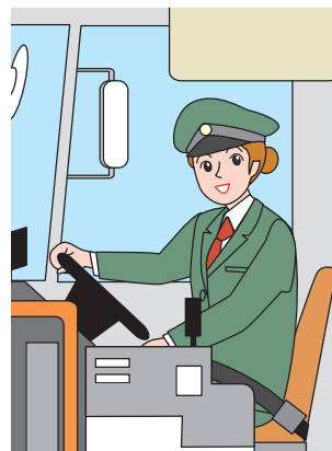
うんてんしゅ 運転手さん