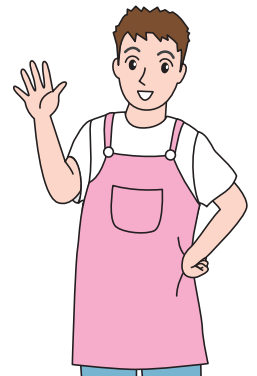
ほいくし 保育士さん

そうかな？ たと へい くし おとこ 例えば、保育士さんにも男の ひと うんてんしゅ おんな ひと しよくぎょう 人、運転手さんにも女の人がいるよね。職業は、 おとこ ひと しごと おんな ひと しごと 性別で決められてしまうのではなく、自分で選 べるんだよ。