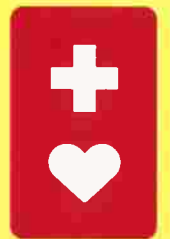
助け合いのしるし ヘルプマーク