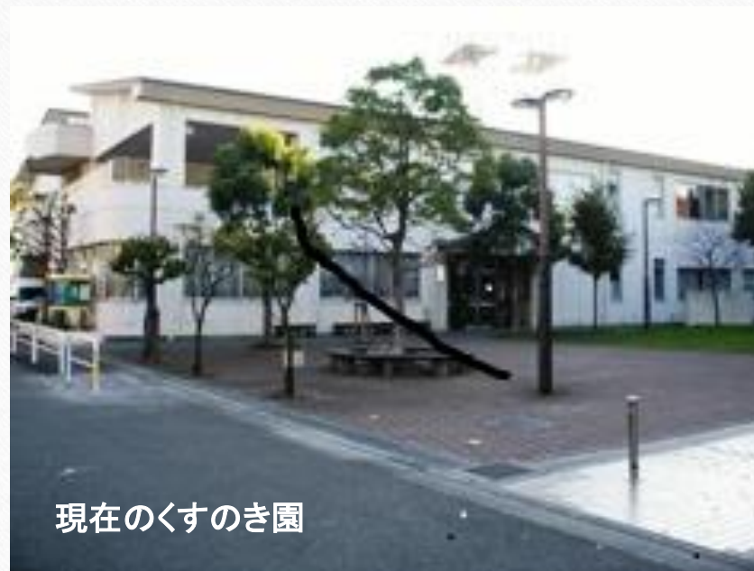
現在のくすのき園