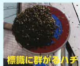
標識に群がるハチ