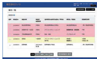
◀報告書登録済みの場合