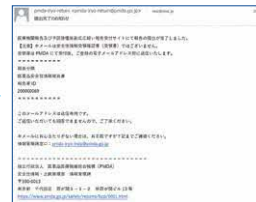
※実際の画面とは異なる場合があります

皆さまからの報告を起点に、厚生労働省、PMDA、製造販売業者など、医療にかかわる人たちが報告情報を活用することで、日本の医療を支えています。