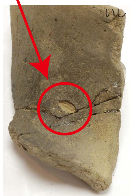
山王遺跡の土器のかけら