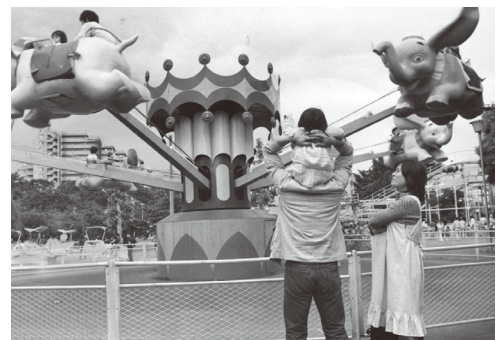
多摩川園の様子