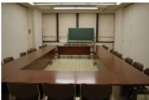
▼ 第1~第3集会室 (定員 24名)