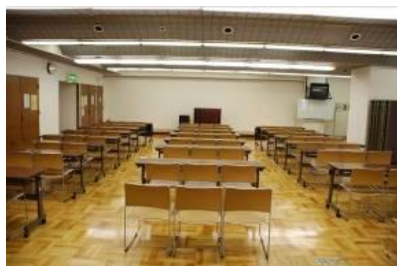
▲ 大集会室 (定員 81~150名)