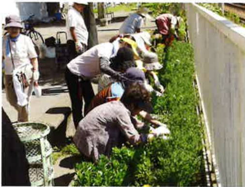
まずは花壇の手入れから

その他にも、理学療法士が指導する体操や公園に隣接する会館での食事会など多数のイベントもあり、参加者の皆さんはすっかり仲良しです。今では活動に協賛する地域の施設・企業・事業所は50を超え、「地域力」で暮らしやすいまちづくりを進めています。