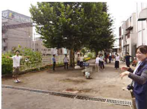
公園いっぱい広がって みんなで体操です