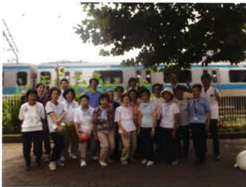
電車も一緒に記念写真 お疲れ様でした!