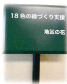
事業 PR プレート