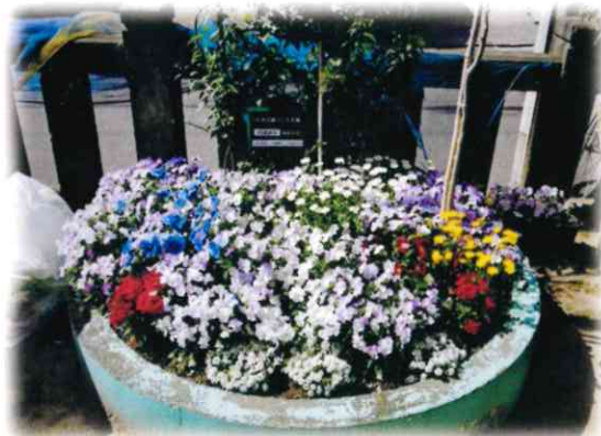
東稻荷児童遊園の花壇

「18色の緑づくり」は、18 特別出張所の地区ごとに「地域の花」を選定して地域みなさんに育てていただき、地区ごとに特色のある景観をつくる取り組みです。「地域の花」の種等は、環境対策課等で配布しています。ぜひ、ふれあいパーク活動での花壇づくりにもお役立てください！！（ご希望の方は、事前に下記お問合せ先へご連絡ください。）