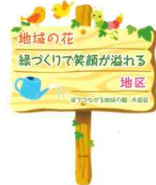
事業 PR 立札