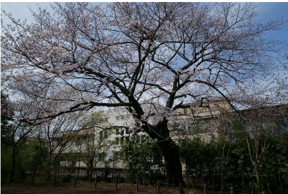
↑ サクラ (千鳥いこい公園)