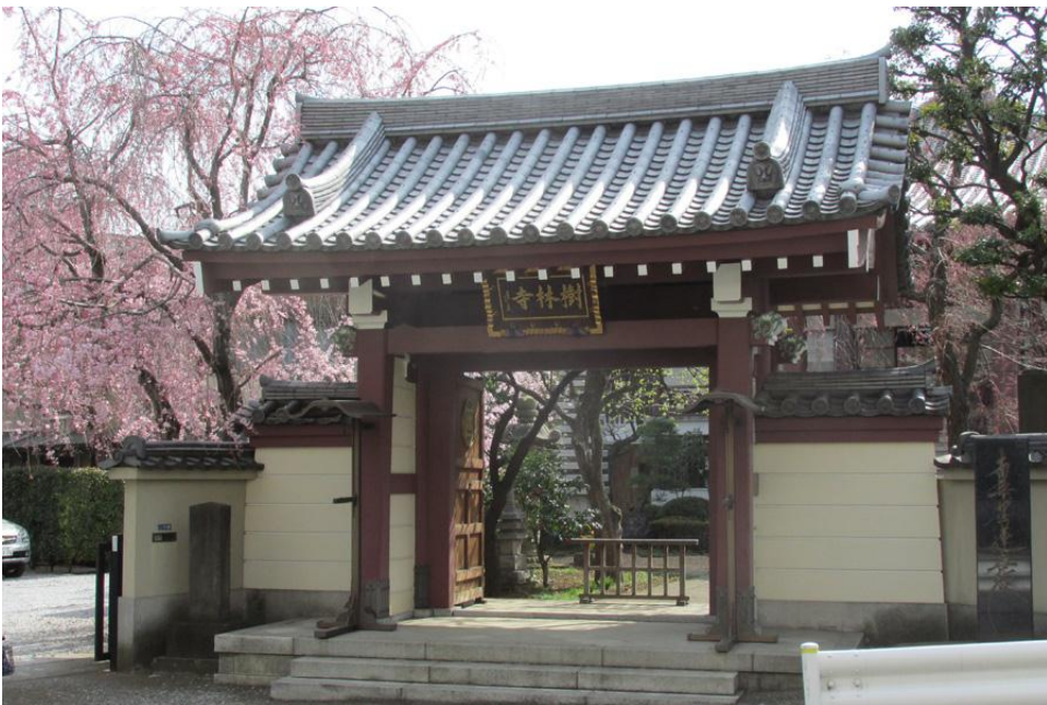
↑ サクラ (樹林寺)4月上旬