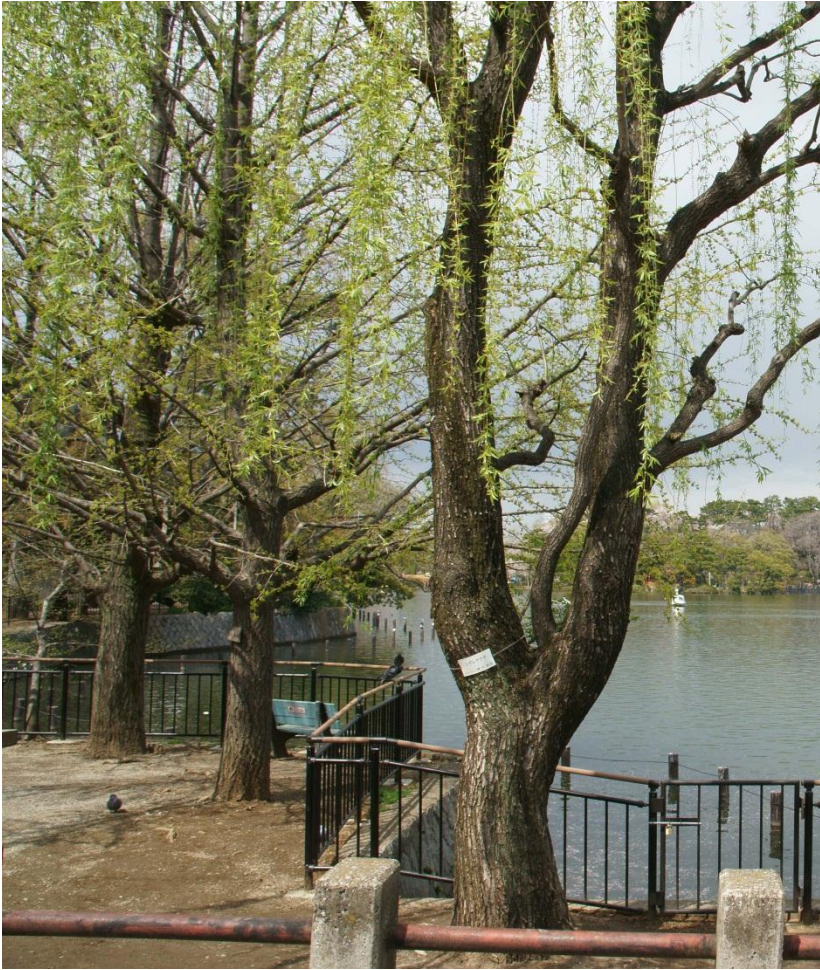
↑ ヤナギ (中原街道 洗足池付近) 4月上旬 ↓