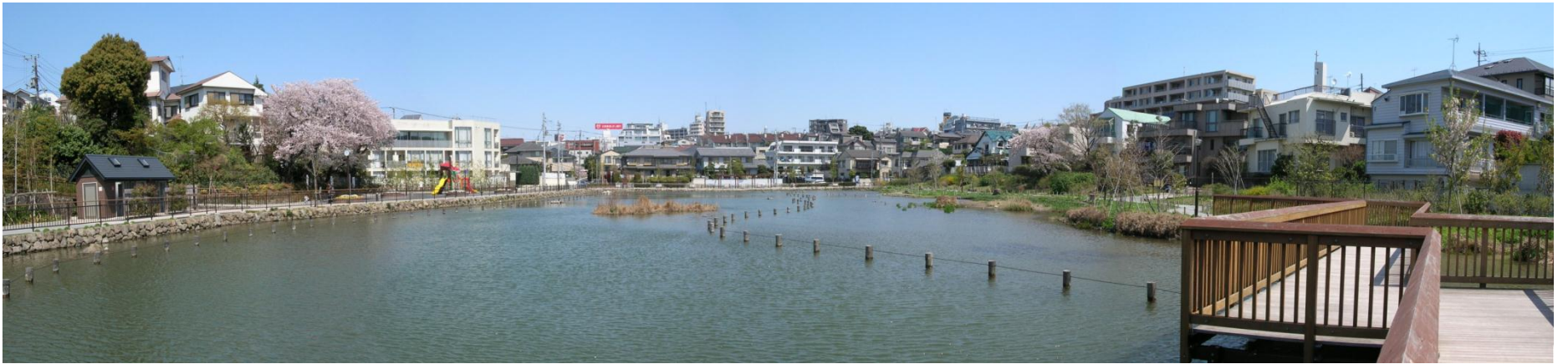
↑ 小池公園 ↓