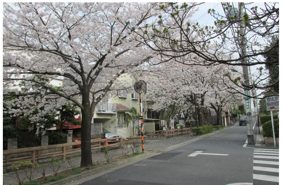
↑ サクラ (洗足流れ) 4月上旬 →