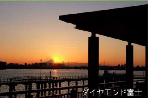
ダイヤモンド富士