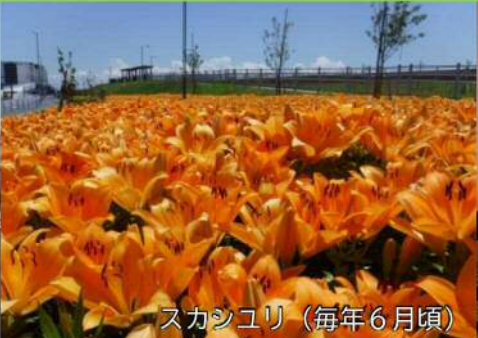
スカシユリ（毎年6月頃）