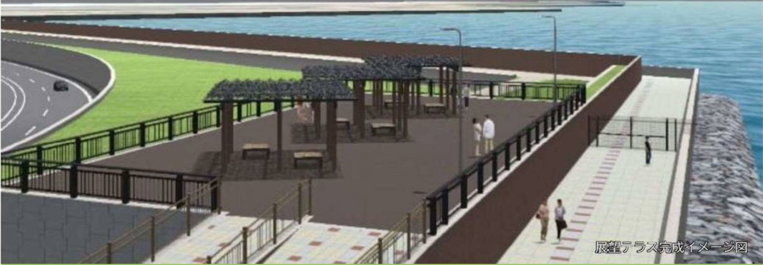
展望テラス完成イメージ図