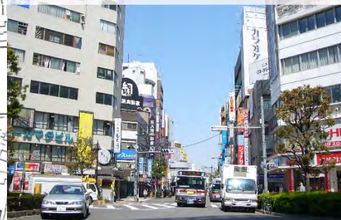
駅街路 3 号線（幅員 18m）