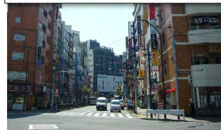
多摩堤通り交差点付近