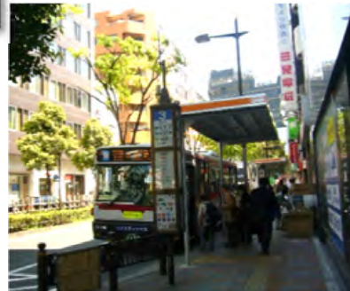
中央分離帯 (駅前広場周辺)