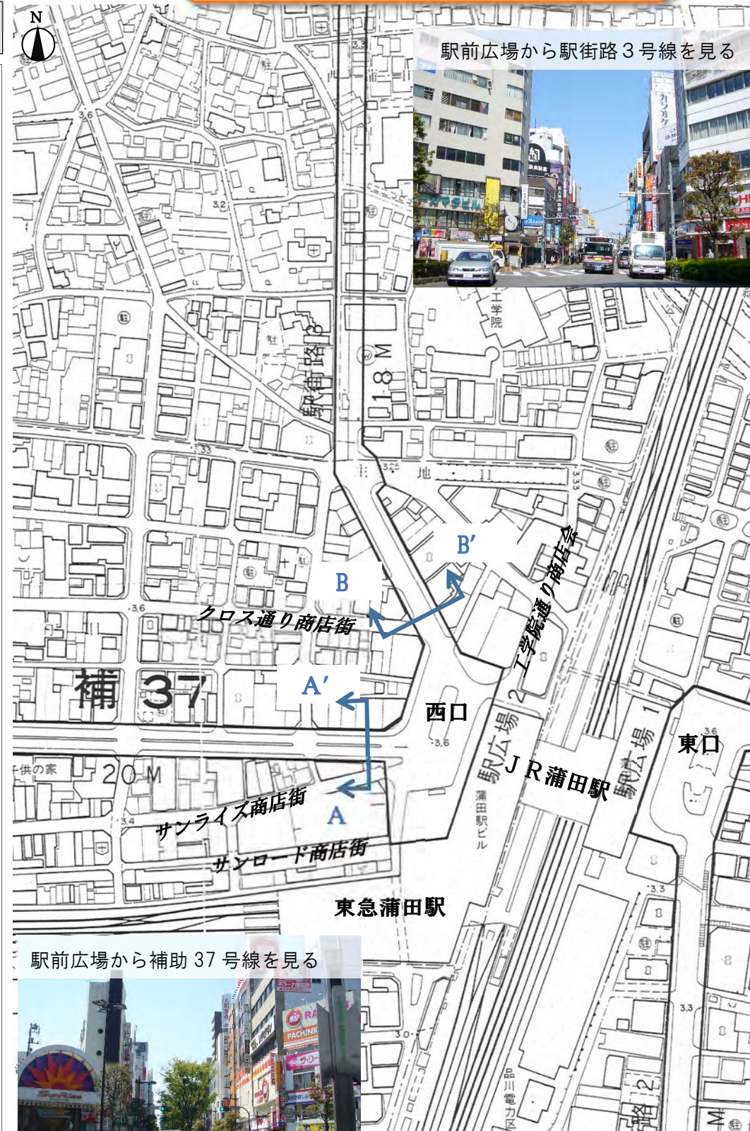
駅前広場から補助 37 号線を見る