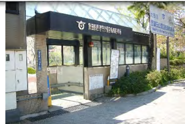
池上線先の自転車駐車場