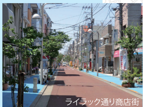
ライラック通り商店街

☆耕地整理とは・・・ 耕地整理法(昭24年廃止)に 基づき、農業上の利用を増進 する目的のため、区画を整理 し、水路や道路の整備を図る 事業です。