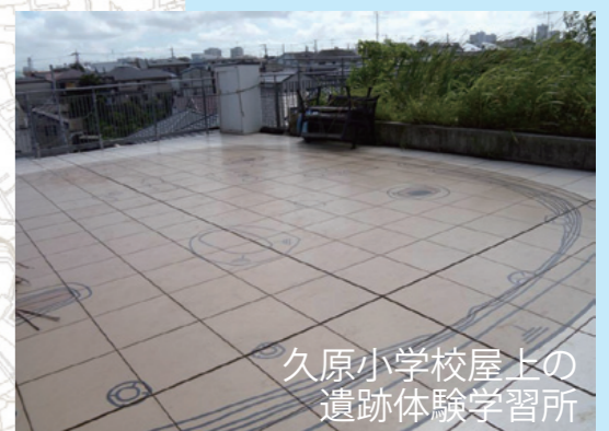
久原小学校屋上の 遺跡体験学習所