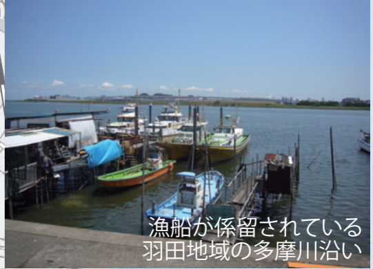
漁船が係留されている 羽田地域の多摩川沿い