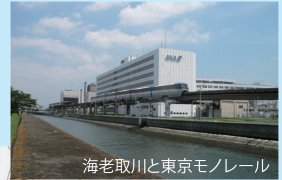
海老取川と東京モノレール