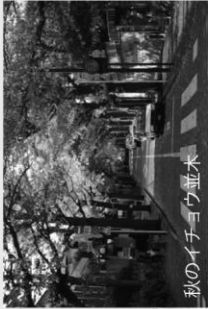
秋のイチチョウ並木

田園調布は第二種風致地区に指定されています。 ☆風致地区とは・・・ 都市環境と自然環境とを調和させて都市における自然のおもむきを維持するため、都市計画法に風致地区の制度が定められています。東京都では東京都風致地区条例で、地区内での建築物の建築・宅地造成・木竹の伐採などを行なう場合に制限がかかります。