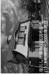
復元した東急田園調布駅舎（1923年建設、2000年再建）

田園調布は、田園都市のモデルとして開発された日本有数の住宅地です。駅から放射状に広がる街路が特徴です。街路沿いに植えられたイチチョウ並木は田園調布の象徴的な景観といえます。