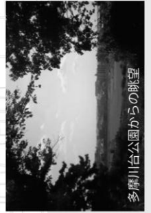
多摩川台公園からの眺望

多摩川台公園には古墳や多摩川を見渡す眺望、広場、桜など、魅力がたくさんあります。公園内には古墳展示室もあるので、立ち寄ってみてください！