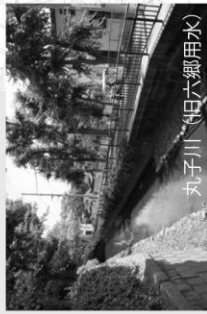
丸子川（旧六郷用水）

所管エリア： 田園調布一丁目、二丁目、三丁目、四丁目、五丁目/ 雪谷大塚町2-23