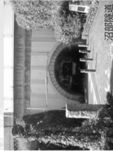
沼部隧道 沼部隧道は、大田区内最古のトンネルです。トンネル内には、東京府だった時代のマンホールが残っています。