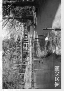
住宅街の中の公園も四季折々の魅力があります。桜や菖蒲を楽しむもよし。カメやカモなど、生き物を眺めるもよし。運が良ければアヒルにも会えるかも!?