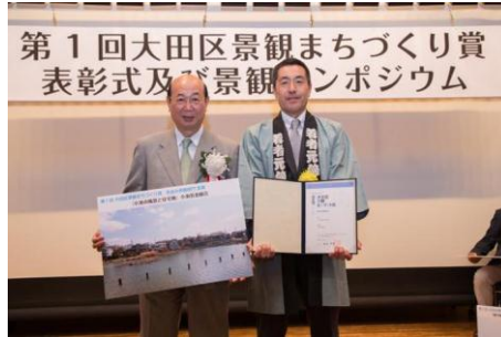
「小池の風景と住宅地」 小池若者組合