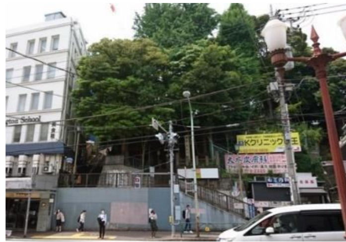
てんそじんじゃ 天祖神社