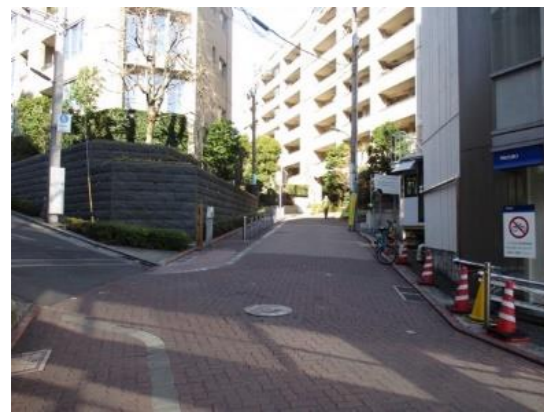
きょうら 清浦さんの坂