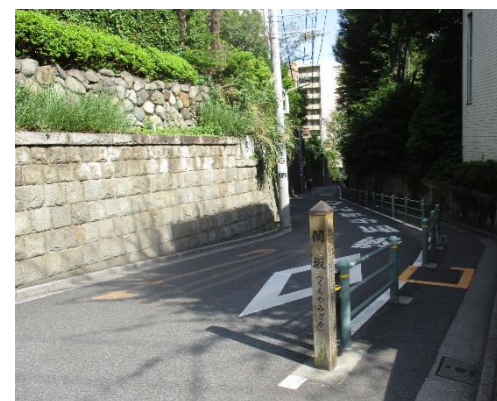
くらやみざか 闇坂