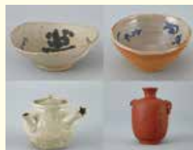
「茶碗「萬壽」他 海舟が作った器4点」