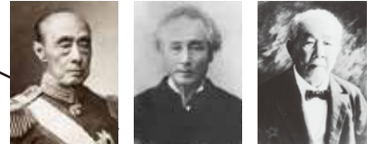
徳川慶喜 勝海舟 渋沢栄一