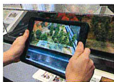
洗足軒の模型にかざす