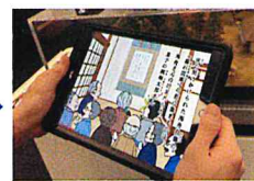
物語がはじまるよ