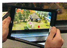
ピンを読み込むと