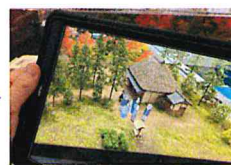
あれ？誰かあらわれた！