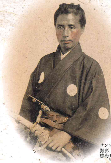
サンフランシスコにて 撮影 勝海舟肖像写真