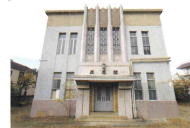
*工事前の旧清明文庫

■平成31年夏の開館を目指し、本年1月から建築工事、3月からは展示ケースなどの制作が始まっています。