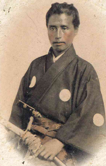
サンフランシスコにて撮影 勝海舟肖像写真